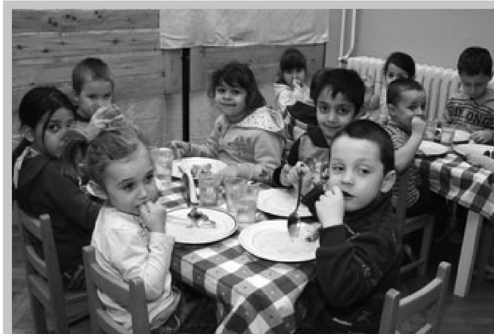
Tiszaigari óvodások ebédelnek. Ha Abádszalók nem jut hozzá a kintlévőségéhez, az ő ellátásuk is veszélybe kerülhet.

Rengeteg egyeztetés és tárgyalás végeredményeként most átmeneti megoldás született. A napokban Tiszaburán megindul az adósságrendezési eljárás. Abádszalók vezetése figyelembe véve és méltányolva a kialakult tiszaburai körülményeket, továbbra is biztosítja az orvosi ügyeletet Tiszaburán a bíróság által kijelölt pénzgondnok fellé-