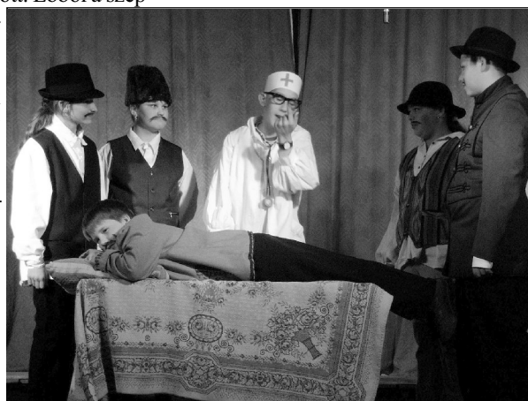
Az oldalt szerkesztette Parázso Katalin

szönni mindenkinek a támogatását, aki pénz- vagy természetbeli adománnyal, személyi jövedelemadójának 1%-nak felajánlásával, támogatójegy vásárlásával hozzájárult az alapítvány vagyonának gyarapításához, valamint a Szülői Munkaközösség tagjainak, a szülőknek, a pedagógusoknak és a gyerekek munkáját, amely nélkül nem valósulhatott volna meg ez a szép és sikeres rendezvény.