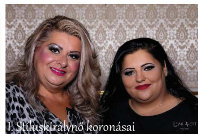
I. Stíluskirálynő koronásai

Oltási igazolás nem feltétel, mivel a rendezény részben szabadtéri, maszk használata azonban javasolt. Belépő előfoglalással: 1000 Ft. I Belépő a helyszínen: 1500 Ft. I Tombola: 400 Ft. I Előfoglalás: 06 70 673 3667