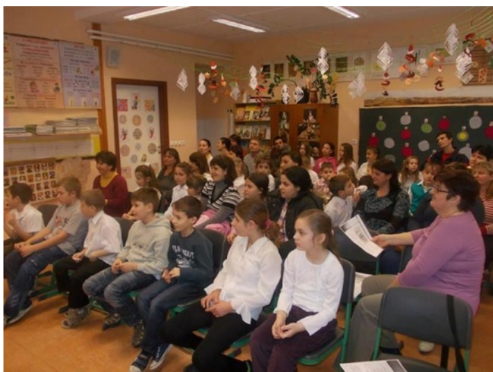
A 1. és a 3. évfolyam helyezettjei