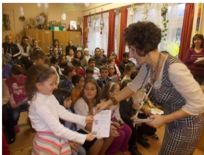
A 2. és a 4. évfolyam helyezettjei