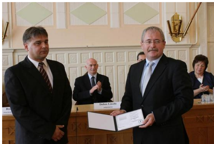
Dr. Fazekas Sándor 2014. április 24-én Karcagon vette át országgyűlési képviselői megbízólevelét.

A Jász-Nagykun-Szolnok Megyei 03. számú Országgyűlési Egyéni Választókerületben megválasztott országgyűlési képviselő: Dr. Fazekas Sándor FIDESZ- MAGYAR POLGÁRI SZÖVETSÉG-KERESZTÉNYDEMOKRATA NÉPPÁRT