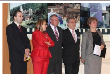
Abádszalók, mint díszvendég Miskolc XXI. Utazási Kiállításán