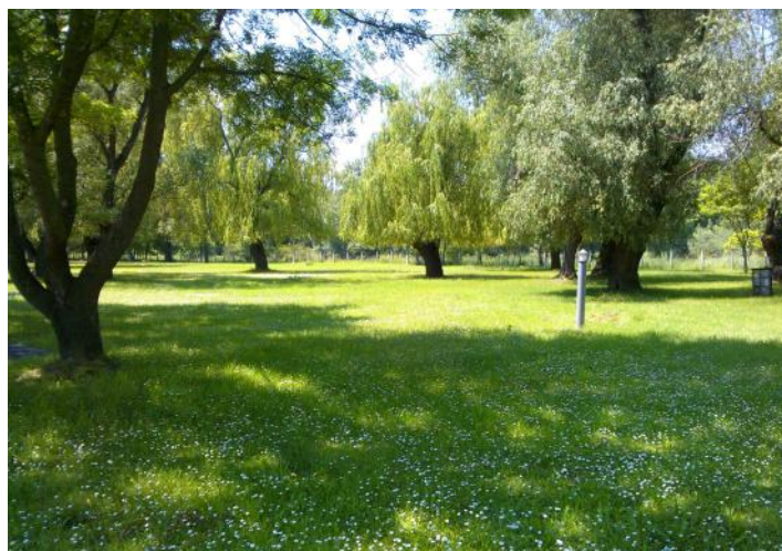
A tanuszoda helye a Füzes Camping-ben