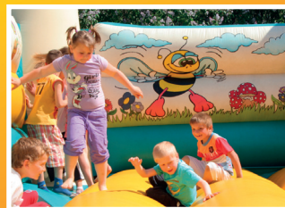
A Városi Majális képekben