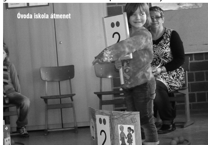
Óvoda iskola átmenet

Ha vendéglátáshoz „szponzorokat” kell keresnünk, - reménykedem benne - segítők kezekre találunk majd.