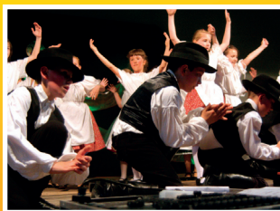
Jótekonysági Gála az iskolában