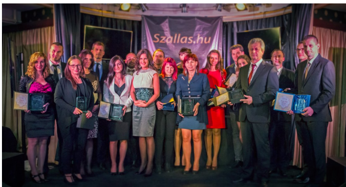
Év Szállása 2014 díjazottak

Budapest, 2014. november 27. – Kiemelkedő eredményeket értek el a Tisza-tónál, valamint Heves és Veszprém megyében található települések az Év Szállása versenyben. Közel 250 000 vendégértékelés és 40 000 szavazat, valamint a szakmai zsűri véleménye alapján megválasztották a legromantikusabb és leginkább családbarát szálláshelyeket is.