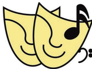
FIGURA SZÍNPAD ABÁDSZALÓK