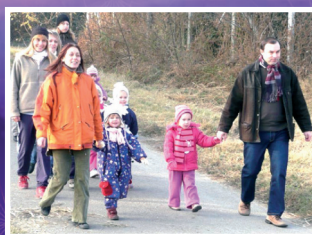
Az Abádi óvoda az egészségért futott