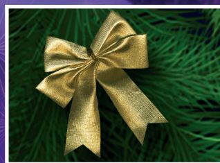
Városi karácsonyi ünnepség