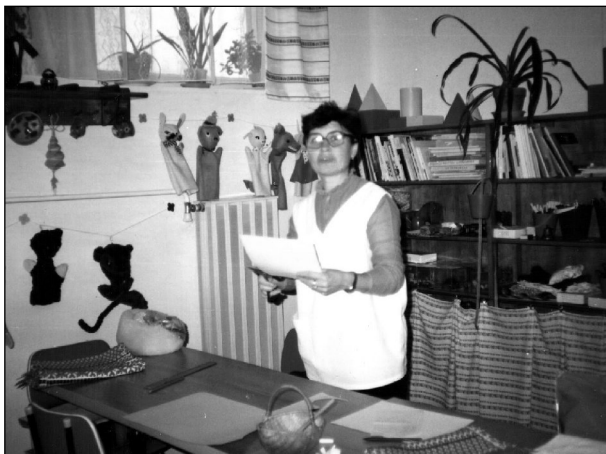
Aktívan, még munka közben

- Igen! Emlékezem arra az 50 év előtti napra, amikor kezembe vettem óvónői diplomámat. Az az idő egy reményekkel, feladatokkal teli idő kezdetét jelentette számomra! Mint mindenki, aki a nagybetűs ÉLETBE kilép - én is tündérkertet álmodtam magamnak. Hogy az évek során váltotta egymást a fény és a vihar - nem csoda - hiszen 38 évet töltöttem el óvónőként a II.sz. óvodában. Óvónéni lettem, akire intézményt és gyermekeket bízta - ez lett a hivatásom. Otthonról haza jártam az óvodába, ahol igyekeztem pótolni a vigasztaló anyukát; a mesét mondó nagymamát; a sebeket ápoló doktor nénit; a természet szépségeit és titkait felfedező kis tudóst; az igazságot osztó bírót és nem utolsósorban a babát öltöztető, ringató, homoktortát formázó játszópajtását. Hogy ez sikerült-e? Talán igen, hiszen a hosszú évek során nagyon sok szeretetet, tiszteletet kaptam a szülőktől, mun-