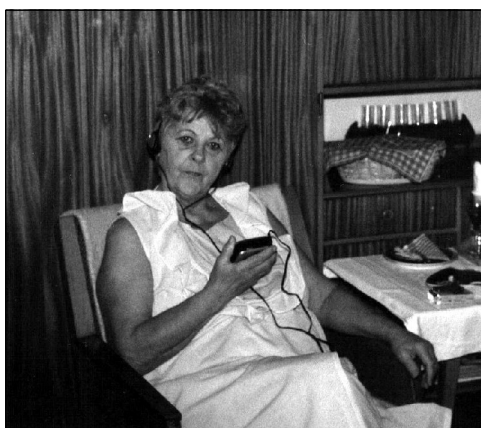
A jól megérdemelt pihenés

- Erzsike néni, miért éppen a tanítói pályát választotta?