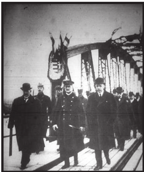
Az 1958-ban helyreállított negyedik híd

Összekötő Vasúti hídnál elbontott régi, hegeszvas anyagú hídszerkezet hossztartóit használták fel. A felújított hídon elsőként Horthy kormányzó sétált át az építők és térségi politikusok társaságában. A helyreállítás után a híd 1944-ig volt forgalomban.