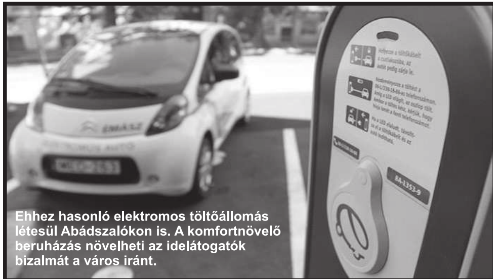
Ehhez hasonló elektromos töltőállomás létesül Abádszalókon is. A komfortnövelő beruházás növelheti az idelátogatók bizalmát a város iránt.

Az idei nyári szezont nem érinti a fejlesztés, de a bontást, a terület előkészítését az építkezéshez, szeptemberben szeretnénk elkezdni, és a következő nyárra birtokba venni az új strandot.